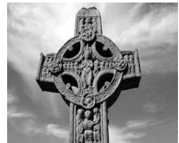
Hochkreuz in Monasterboice

Während unserer Rundfahrt werden wir die Mitte und den nördlichen Teil der Republik Irland besuchen. Ein Abstecher nach Nordirland ist inklusive. Neben den Metropolen Dublin und Belfast werden wir romantische Klostersiedlungen, den idyllischen Nationalpark Connemara und weitere einzigartige Ziele in sattgrüner Landschaft ansteuern.